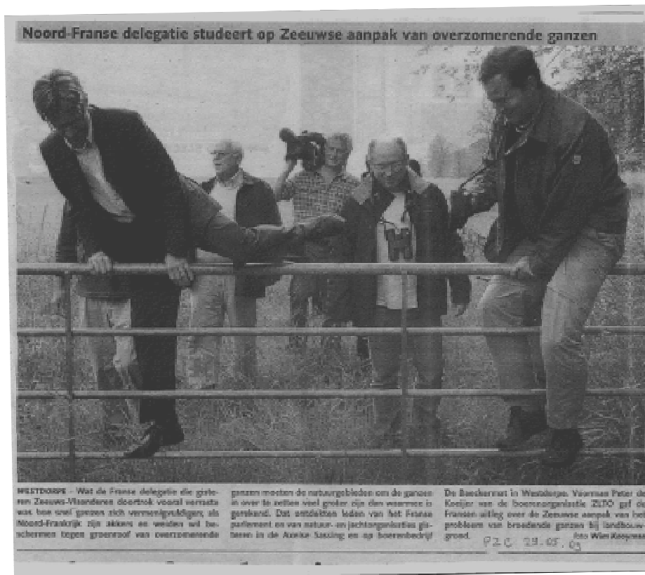
Coupure de presse lors de la mission aux Pays-Bas, mai 2009

www.migration.net : Anser anser , effectif annuel sur les cols pyrénéens (Col de Lizarieta, Col d'Organbidexka, Redoute de Lindux) downloaded on 2009-09-29.