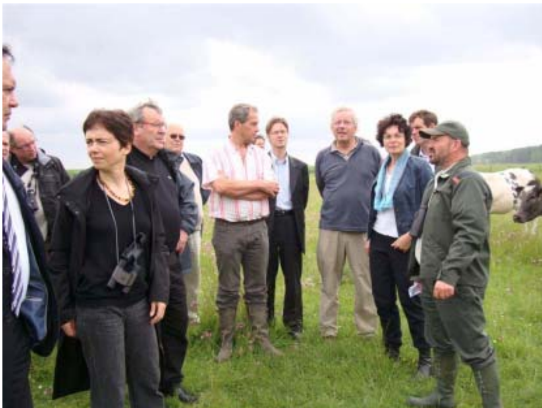
La mission aux Pays-Bas, mai 2009